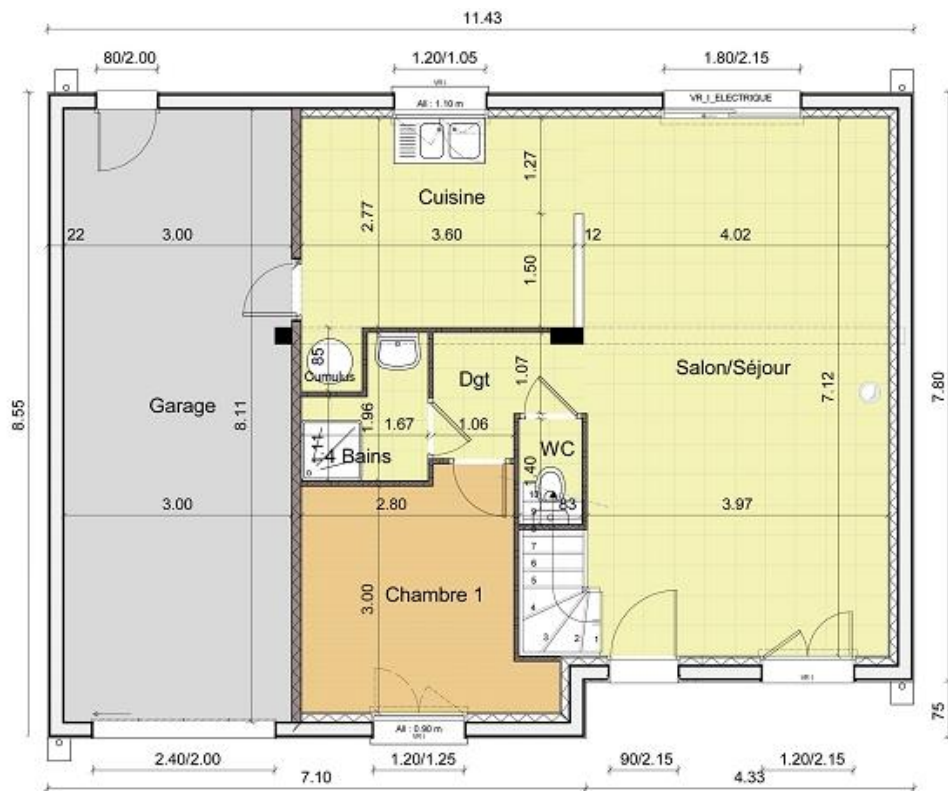
Plan du 1 er étage – Echelle 1/100ème