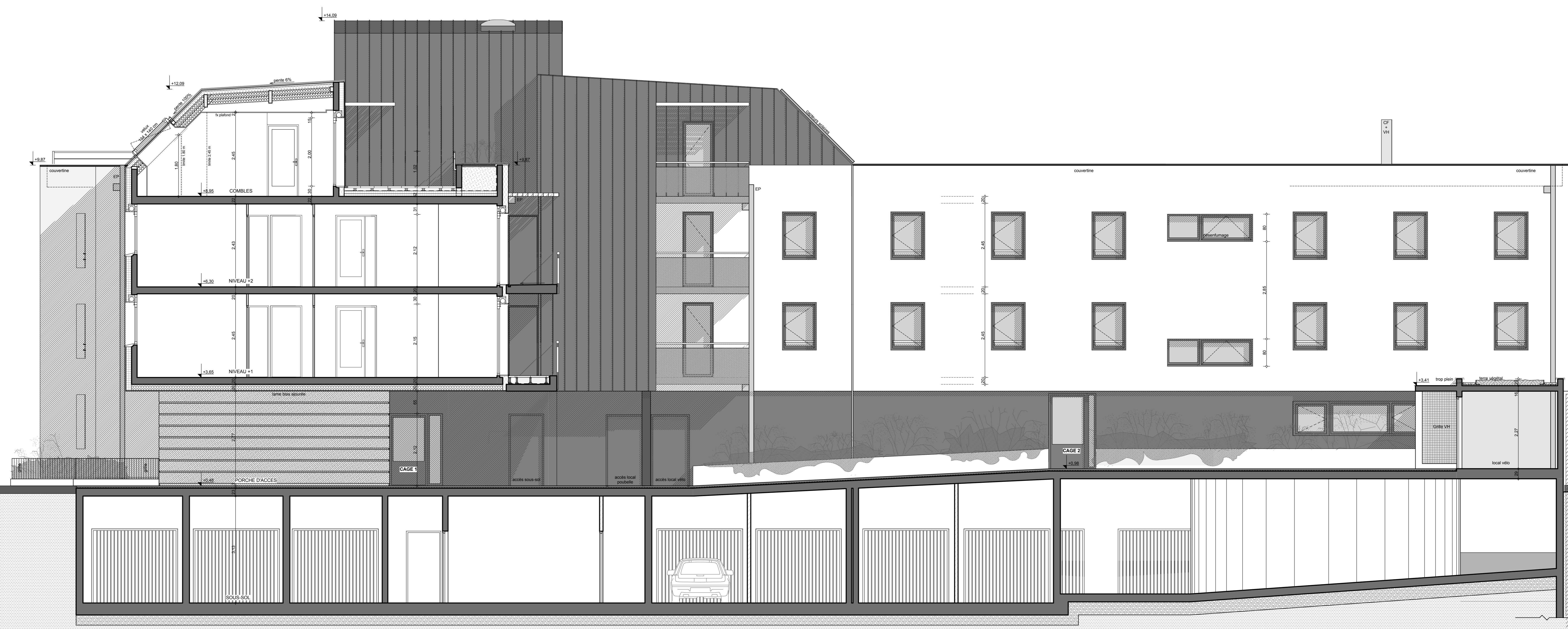
COUPE FACADE OUEST